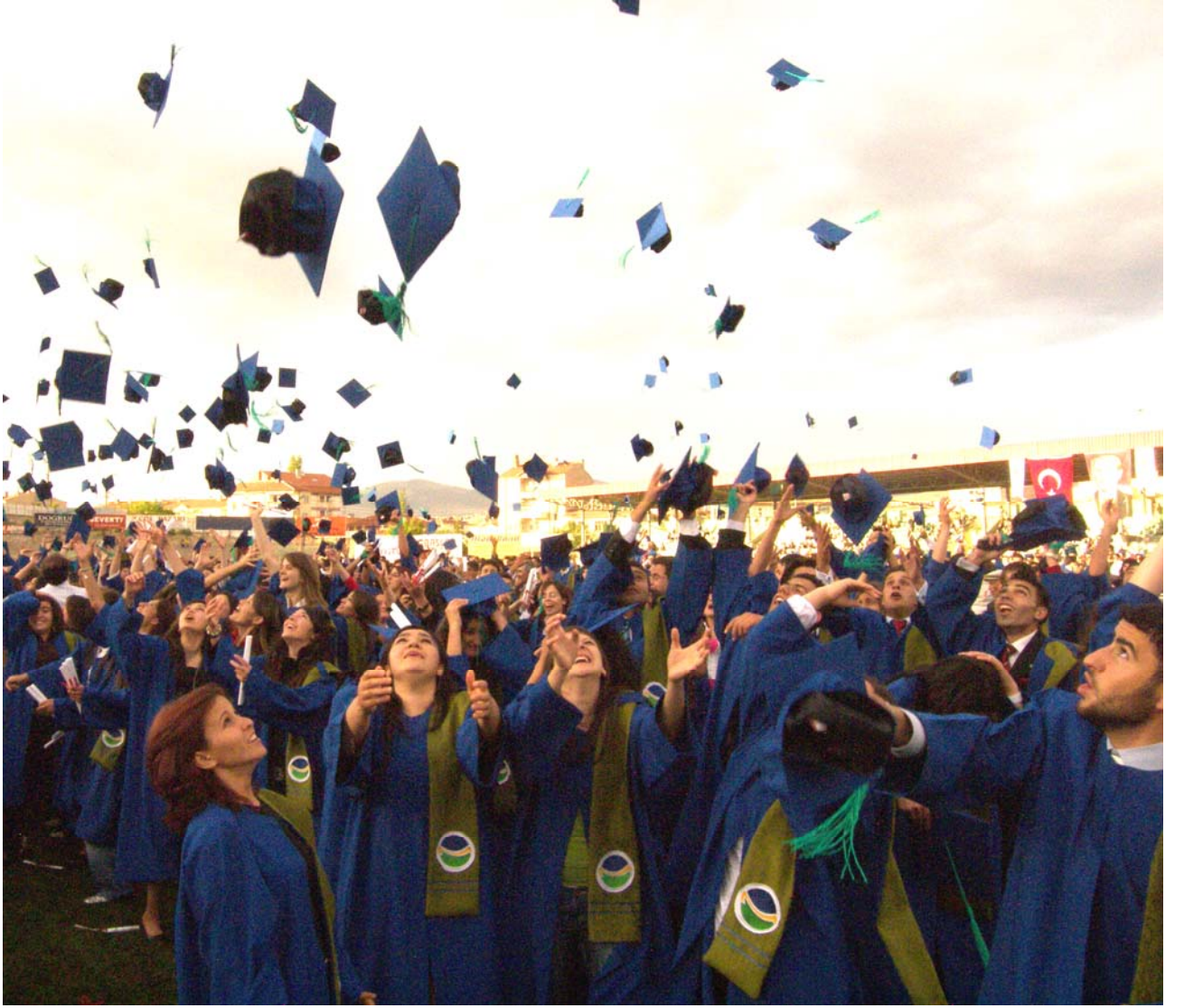
Üniversitemiz mezuniyet töreninden bir görünüm.