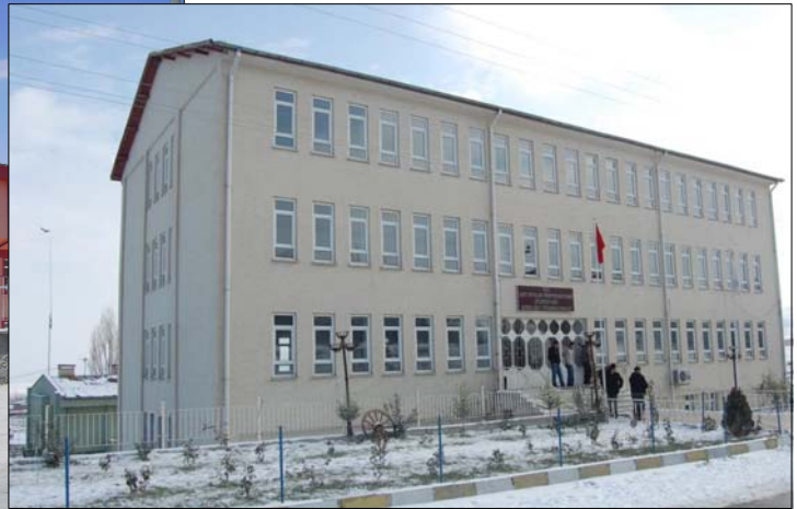
Çiçekdağı Meslek Yüksekokulu