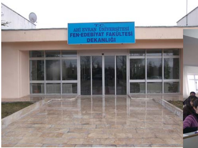
Fen-Edebiyat Fakültesi ve dersliđi