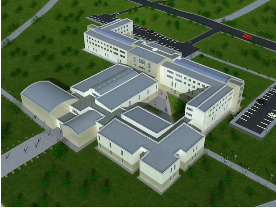
Bağbaşı Yerleşkesi'nde inşaatı devam eden Fen-Edebiyat Fakültesi binalarının maket görünümü