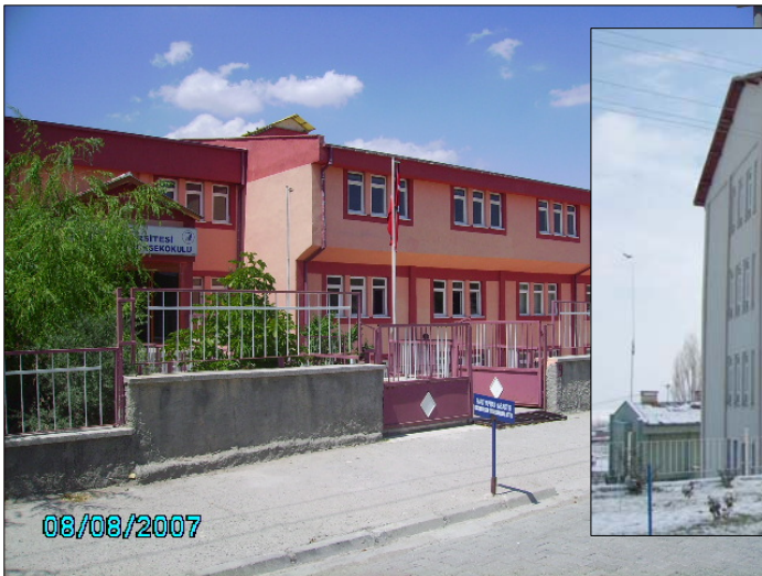
Mucur Meslek Yüksekokulu