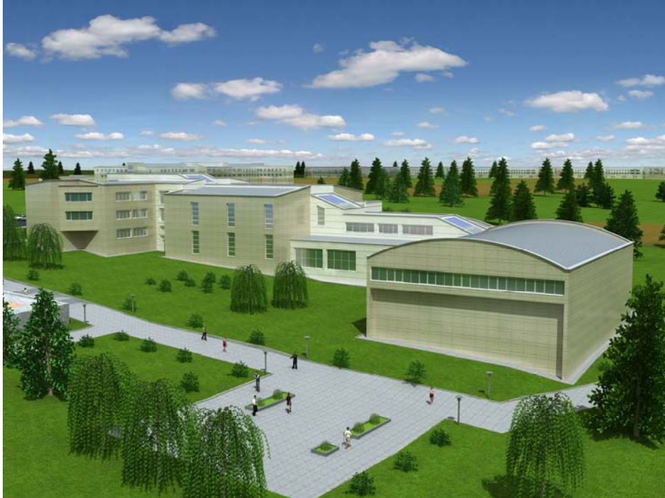
Bağbaşı Yerleşkesi'nde inşaatı devam eden Beden Eğitimi ve Spor Yüksekokulu binalarının maket görünümü