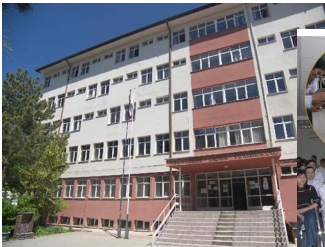
Sađlık Yüksekokulu ve ders uygulaması