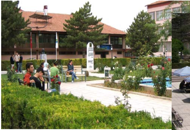
Eđitim Fakültesi ve öğrenci dinlenme alanı