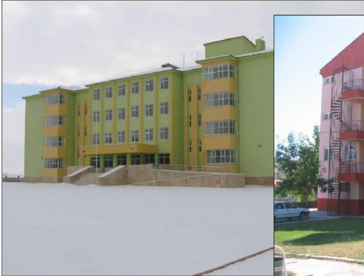
Kaman Meslek Yüksekokulu