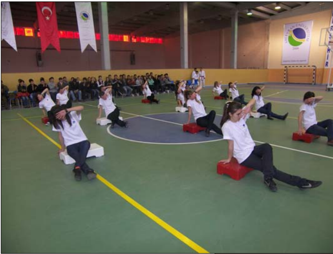
Beden Eğitimi ve Spor Yüksekokulu kapalı spor salonları

Tüm bu yapılanma esas alınarak oluşturulan Üniversitemiz organizasyon şeması Tablo 1'de verilmiştir.